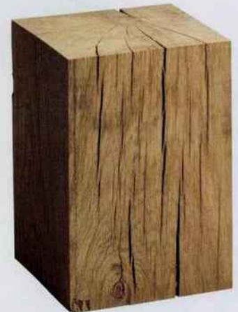
Ce bout de canapé peut aussi faire office de chevet. En chêne massif brut de sciage. H. 45 x L. 30 x l. 30 cm. 159,60 €. AM.PM.