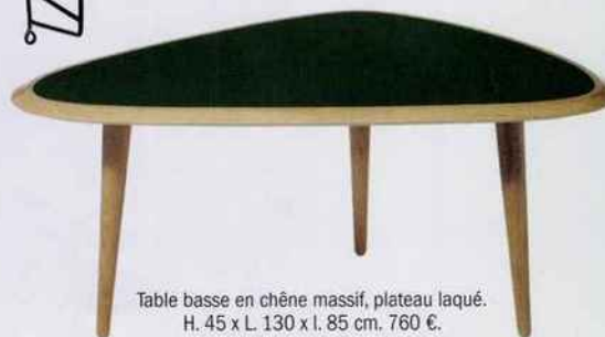
Table basse en chêne massif, plateau laqué. H. 45 x L. 130 x l. 85 cm. 760 €. Red Edition. Le Cèdre Rouge.