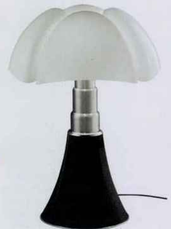
Lampe Pipistrello designée par Gae Aulenti en 1965. Bras télescopique en acier inoxydable brossé. H. 66 à 86 x Ø 55 cm. 734 €. Light on Line.