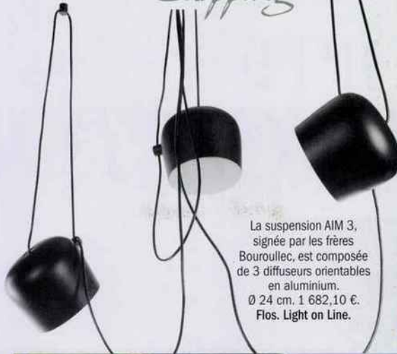
La suspension AIM 3, signée par les frères Bouroullec, est composée de 3 diffuseurs orientables en aluminium. Ø 24 cm. 1 682,10 €. Flos. Light on Line.