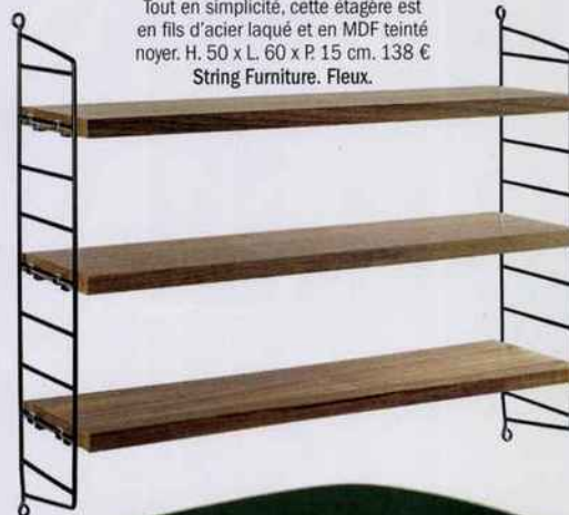
Tout en simplicité, cette étagère est en fils d'acier laqué et en MDF teinté noyer. H. 50 x L. 60 x P. 15 cm. 138 €. String Furniture. Fleux.