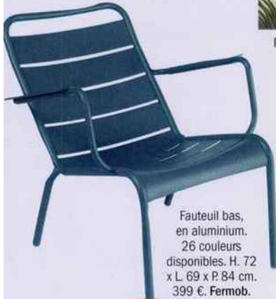
Fauteuil bas, en aluminium. 26 couleurs disponibles. H. 72 x L. 69 x P. 84 cm. 399 €. Fermob.