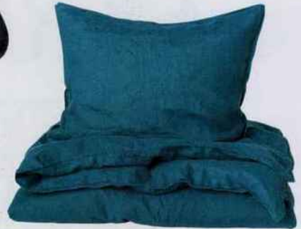
Parure de lit en lin lavé. À partir de 9,99 € la taie d'oreiller. H&M Home.