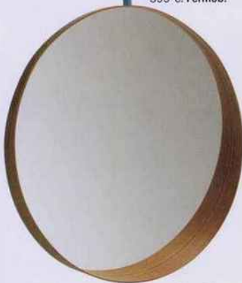
Le cadre de ce miroir, en placage frêne, forme une tablette à la base. Ø 80 cm. 99 €. Ikea.