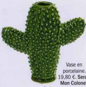
Vase en porcelaine. 19,80 €. Serax. Mon Colonel.