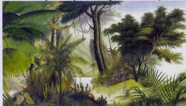
Partez explorer la forêt enchantée au bord du Rio Orinoco avec ce papier peint panoramique. Plusieurs dimensions. H. 220 x L. 300 cm : 1 030 €. Ananbô